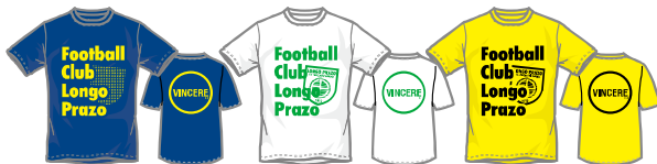
⑬チームTシャツNVY ⑭チームTシャツWHT ⑮チームTシャツYEL