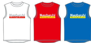
⑯WHT⑰RED⑱BLU ノースリーブシャツ