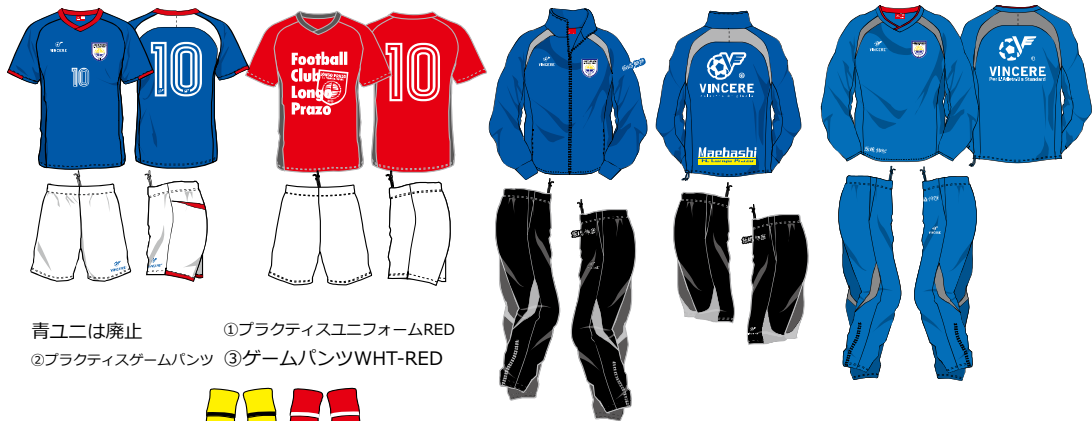
青ユニは廃止 ①ブラクティスユニフォームRED ②ブラクティスゲームパンツ ③ゲームパンツWHT-RED